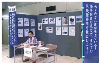
救う会署名コーナーを設置