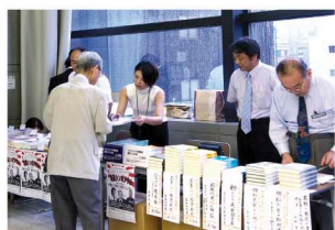
書籍販売コーナー